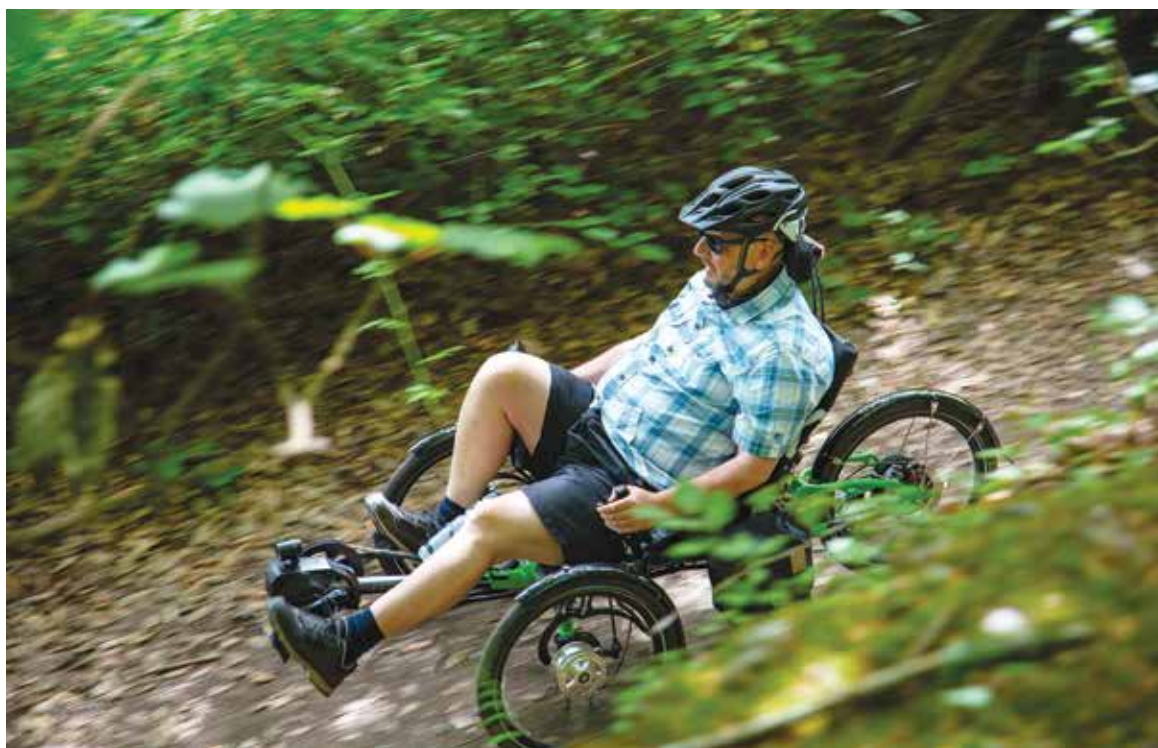
De ICE Adventure Steps.

Als je ooit hebt afgevraagd waarom mensen op trikes rijden, maak dan zelf eens een ritje om te zien hoe comfortabel ze echt zijn. Duizenden rijders over de hele wereld hebben de voordelen van het rijden op een ICE trike ontdekt. Ga naar www.icetrikes.co of bezoek uw plaatselijke dealer. <