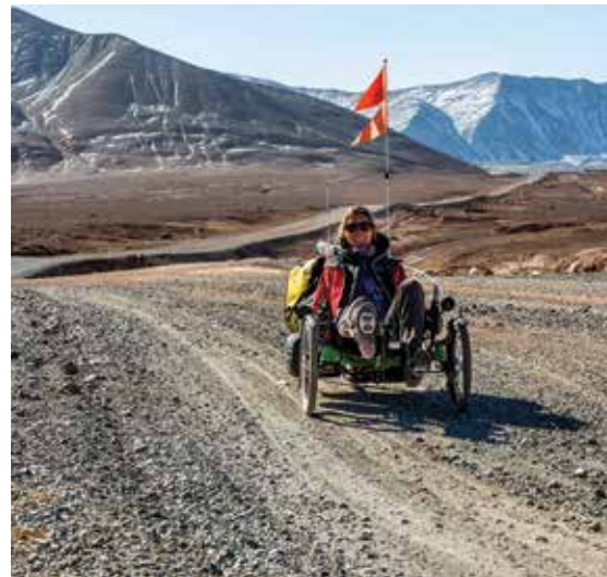
Azub TRIcon 26.

Onze toewijding aan hoogwaardige kwaliteit heeft ons internationale erkenning opgeleverd, waaronder de prestigieuze Trike of the Year -prijs voor de Azub TRIcon 26 in 2015 en de Ti-FLY 26 en X in 2016 en 2018. Maar onze grootste prestatie is de impact die we hebben op het leven van onze klanten.