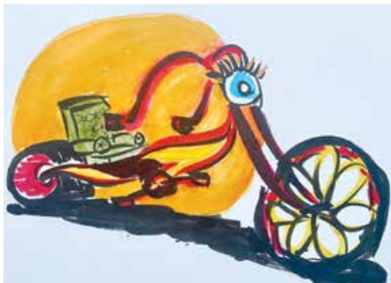
Model 'Delta', twee wielen achteraan.

Van de driewielers zag ik alleen maar stevige fietsen zoals van Van Raam. Helaas niet zo flitsend vormgegeven maar wel rood en in het echt zag ik alleen maar blije mensen erop en als bedrijf ben ik fan van Van Raam. Dus dat zou hem dan worden? Hij was wel erg zwaar. En waarom toch vierkante buizen en alles hoekig. Zegt dat 'degelijk' in de wereld van veilige fietsen voor ietwat wiebelige mensen?