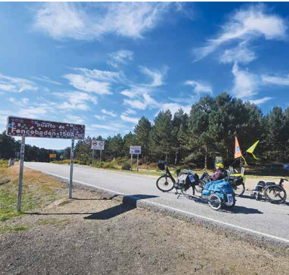
Menno en Willemijn op weg naar Santiago de Compostella. Zie ook pagina 40.