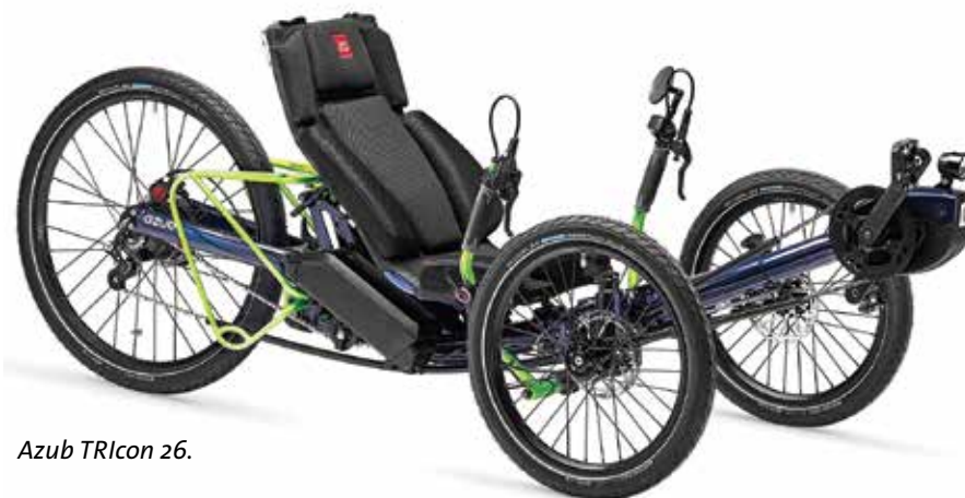
Azub TRIcon 26.

Ben je op zoek naar een aangepaste fietsoplossing? Neem contact op met een van onze Nederlandse dealers of bezoek www.azub.eu om de mogelijkheden te bekijken en de eerste stap te zetten naar herwonnen vrijheid op drie wielen. <