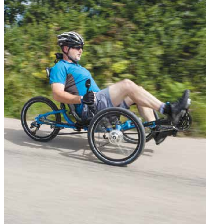
De ICE Adventure HD.

ICE maakt zes modellen trikes vanuit het hoofdkantoor in Falmouth (VK). Van sportieve race trikes tot comfortabele elektrische tour trikes en zelfs off-road trikes die sterk genoeg zijn om de alle paden te trotseren. Alle ICE trikes zijn ongelooflijk gemakkelijk en leuk om op te rijden, je hebt er weinig tot geen ervaring voor nodig. Sommige hebben zelfs een volautomatische versnelling waarbij je alleen maar hoeft te trappen en gaan!