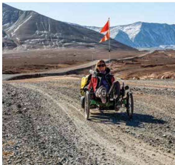
Azub TRIcon 26.

Onze toewijding aan hoogwaardige kwaliteit heeft ons internationale erkenning opgeleverd, waaronder de prestigieuze Trike of the Year -prijs voor de Azub TRIcon 26 in 2015 en de Ti-FLY 26 en X in 2016 en 2018. Maar onze grootste prestatie is de impact die we hebben op het leven van onze klanten.